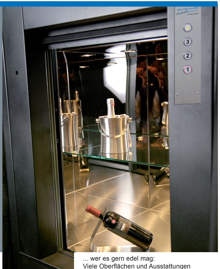
... wer es gern edel mag: Viele Oberflächen und Ausstattungen möglich