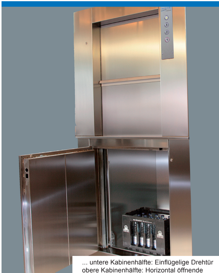
... untere Kabinenhälfte: Einflügelige Drehtür obere Kabinenhälfte: Horizontal öffnende Schiebetür